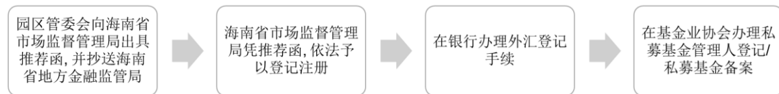
QFLP 基金管理人/QFLP 基金设立流程

QFLP 基金管理人完成在基金业协会的登记之后，其方可以开始募集、设立 QFLP 基金。QFLP 基金的设立与 QFLP 基金管理人的设立在流程上具有一致性，同样需要由园区管委会向海南省市场监督管理局出具推荐函，由海南省市场监督管理局凭推荐函为 QFLP 基金办理登记注册，登记注册完成后 QFLP 基金可以在银行办理外汇登记手续。此后，QFLP 基金作为私募股权投资基金，需要由 QFLP 基金管理人在基金业协会为其办理私募基金备案。QFLP 基金在基金业协会完成备案之后，方可开始进行对外投资。